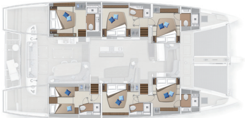
Version cuisine centrale - 6 cabines Central galley version - 6 cabins