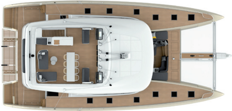
Loose furnitures by Tribù Loose furnitures by Tribù