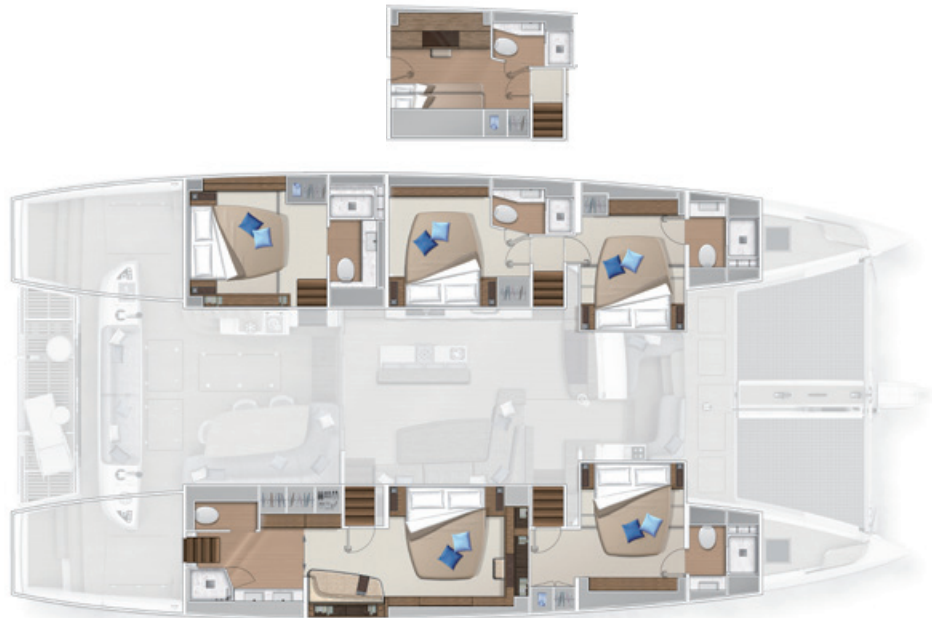
Version cuisine centrale - 5 cabines Central galley version - 5 cabins