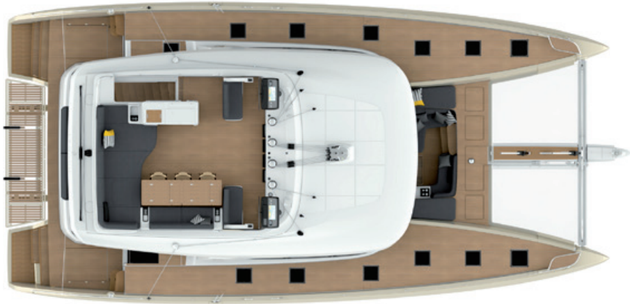
Bains de soleil Sunlounger pads