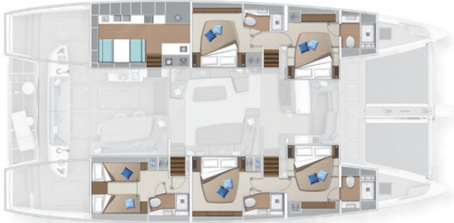
Version cuisine latérale - 5 cabines Lateral galley version - 5 cabins